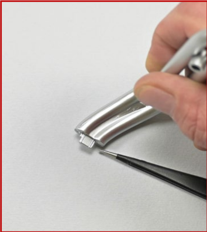
5 Das Foto zeigt den Zapfen des Auspuffrohrs 19C .