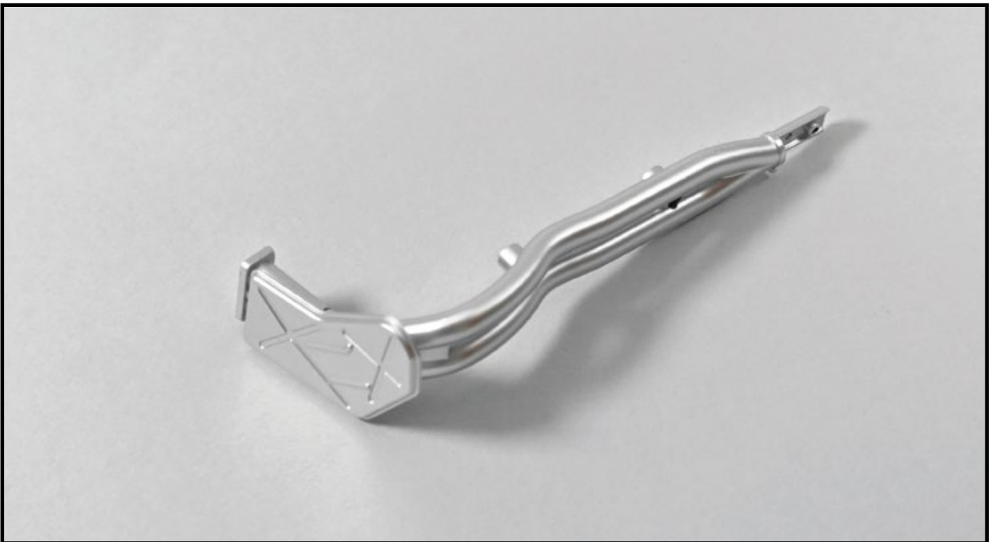
BAUERGBNIS: Die Montage der Abgasanlage hat begonnen. Bewahren Sie die Baugruppe sorgfältig auf, bis in Ausgabe 28 Motor und Auspuffrohr an der Bodenplatte befestigt werden.