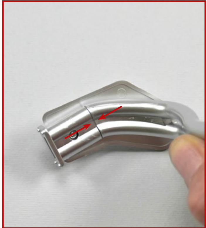
6 Richten Sie das Auspuffrohr 19C und das Verbindungsstück 19A wie gezeigt aus und fügen Sie sie zusammen, bis ihre Kanten bündig sind.