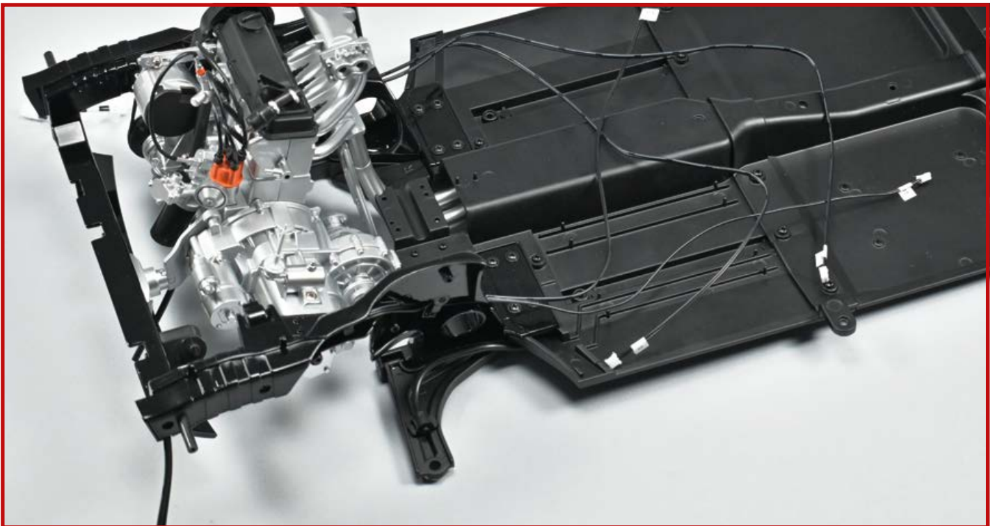
5 Nehmen Sie die Baugruppe, an der Sie zuletzt in Ausgabe 28 gearbeitet haben, und legen Sie sie wie gezeigt vor sich.