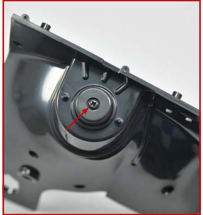
4 Fixieren Sie die Teile mit einer Schraube PS25 .