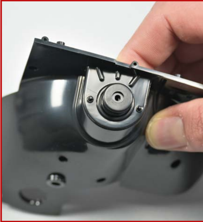
3 Setzen Sie die Kappe 29C auf das hervorstehende Ende des Domlagers 29B .